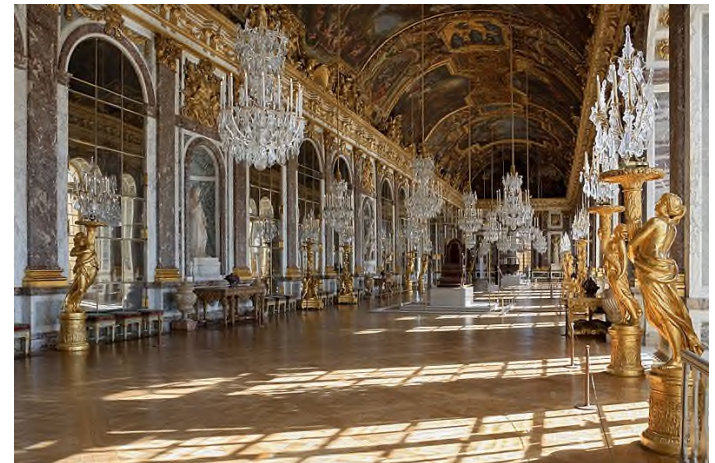
Spiegelsaal im Schloss Versailles, dem Sitz von König Ludwig XIV

So konnte sich der Sonnenkönig nun von Kopf bis Fuss bewundern.