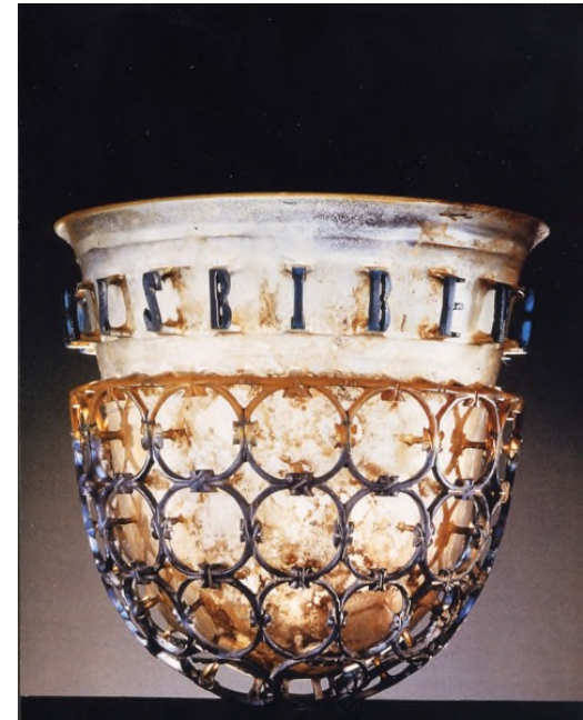
Bildquelle: www.wikipedia.org , Glas Kunstvolles Römisches Glas

Bis zur Entwicklung der ersten Glasschmelzöfen und dem Bau der ersten Glashütten dauerte es noch ein Weilchen. Erst ab 200 v. Chr. sind diese verbreitet im römischen Reich anzutreffen.