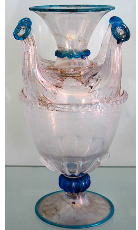
Façon de Venise, vaso soffiato e inciso, xvii sec. Museo della città di Rimini

Die Krönung war die Herstellung von reinstem Kristallglas mit einem fantastischen Glanz und absoluter Farblosigkeit.