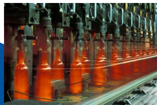
Hier sieht man die Herstellung von Glas aus dem Altglas.