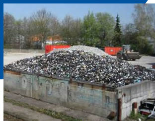
Danach wird das Altglas im Zwischenlager deponiert und dann mit Lastwagen oder Zug in die Glasfabrik gebracht.