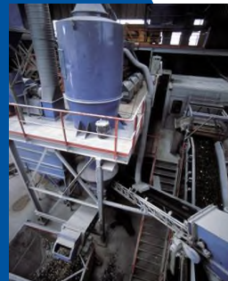
In der Aufbereitungsanlage wird das Glas von Abfall befreit, damit neues Glas hergestellt werden kann.