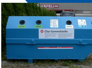
Das Glas muss nach Farben getrennt in den öffentlichen Sammelstellen abgegeben werden.